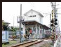
伊予鉄道中線土居田駅