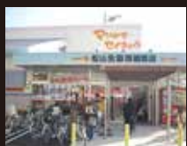
松山生協西雄郡店