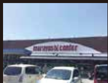
マルヨシセンター椿店