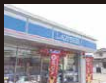
ローソン松山椿神社前店