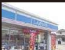
ローソン松山椿神社前店