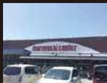
マルヨシセンター椿店