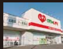
くすりのレディ 東石井店