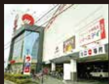
マルナカ 東石井店