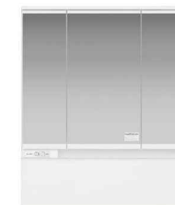
スリムLED3面鏡 ミドルパネル