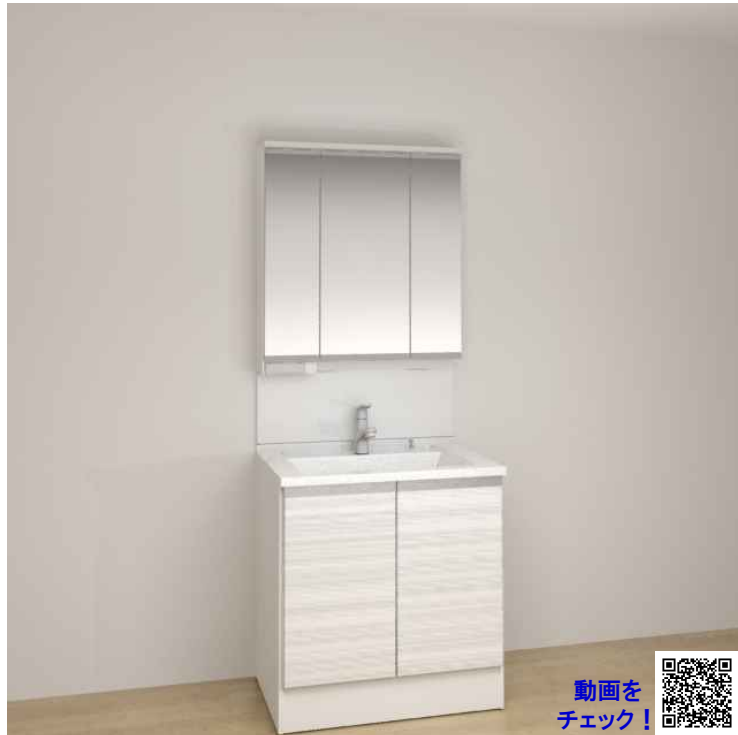
※画像はイメージです。組合せなどはお見積書をご確認ください。