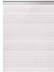
アルベロホワイト(鏡面)