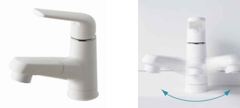
マルチシングルレバーシャワー(スゴビカタイプ) ※シャワーヘッドは引き出せます。 汚れがとれやすく、お手入れしやすい素材。吐水部を左右に首振りできます。