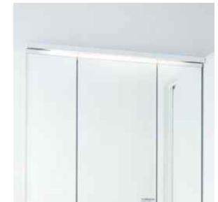
薄型のLED照明で空間すっきり。省エネ・長寿命を実現しています。点灯幅は685mm。