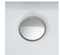
掃除しにくいフチの隙間がない排水口。