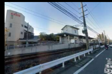
伊予鉄郡中線 土居駅