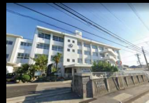
松山市立雄新中学校