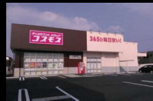
ディスカウントドラッグ コスモス土居店