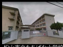
松山市立たちばな小学校